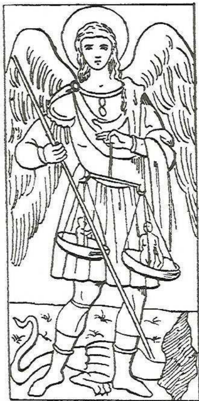
São Miguel pesando as almas dos mortos (século XV)