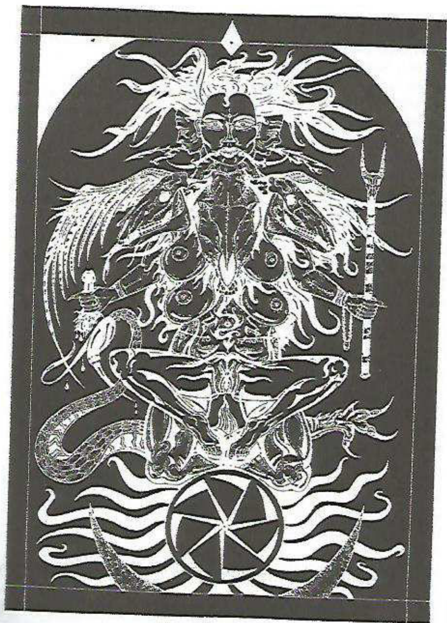
Lilith, por Andrew D. Chumbley. Direitos Autorais ADC (2003).