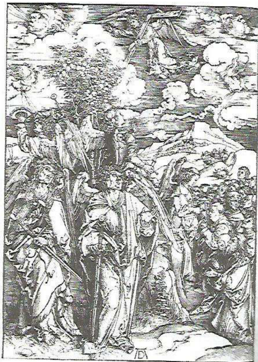
Os quatro arcanjos como os quatro ventos