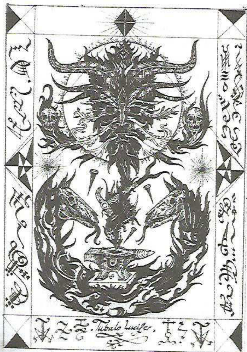
Tubalo-Lúcifer por Andrew D. Chumbley. Direitos Autorais ADC 2003