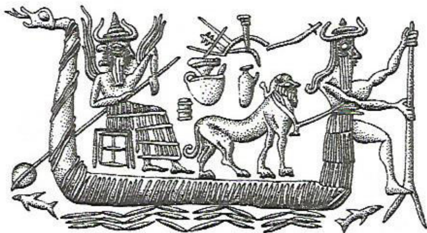
O barco solar de Shamesh