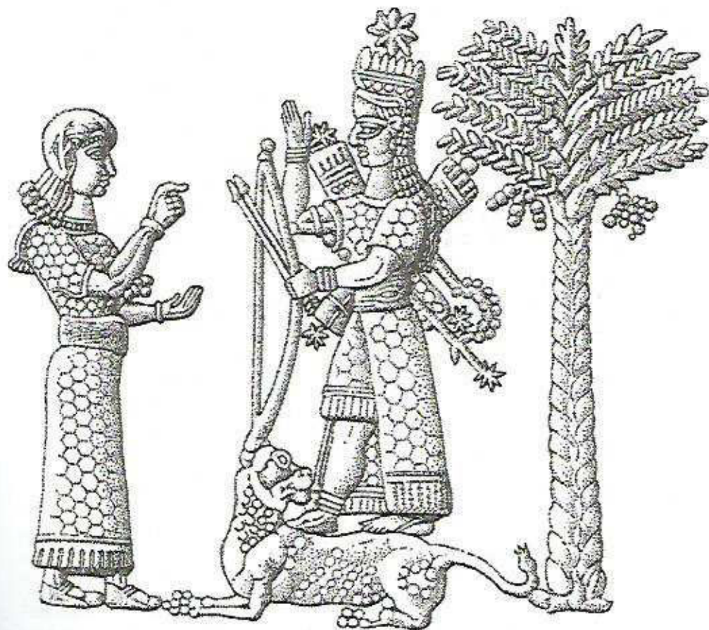
Ishtar e a Árvore da Vida

datada de 35 mil anos e retrata um homem em pé, em uma posição de pentagrama ou estrela de cinco pontas. Ele leva uma espada, ou bastão, pendurado no cinto e tem uma perna menor que a outra, o que o torna coxo (BBC News, 21 de janeiro de 2003). Nos mitos antigos, Órion era um “poderoso caçador” que foi exilado ou preso ao céu. Em Jó 38:31, ele pergunta a Deus: “Não poderás tu ajuntar as doces influências das Pléiades [Ishtar], ou afrouxar os cordéis de Órion? [Semiaza]”.